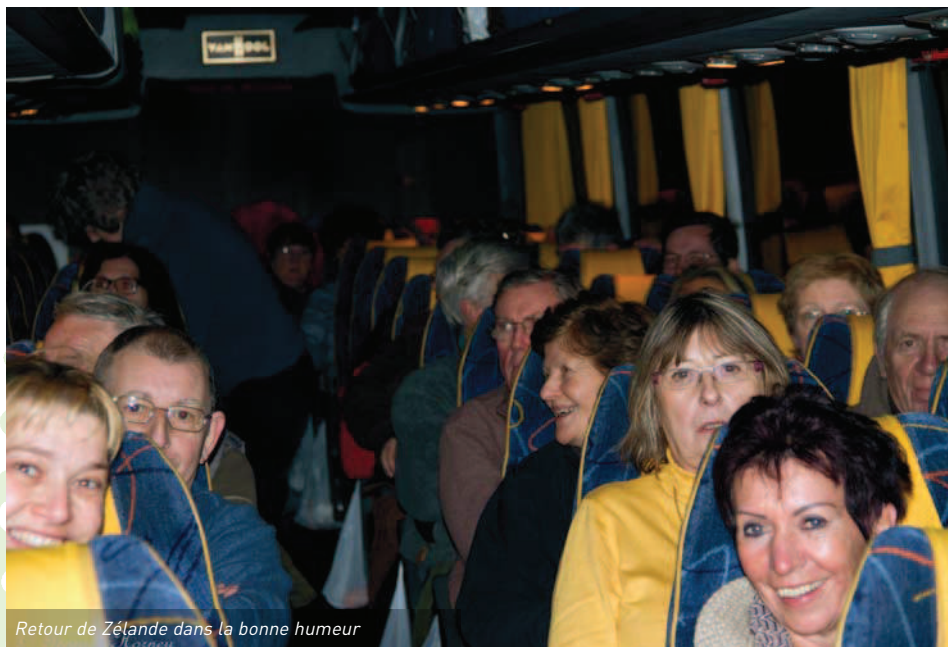
Retour de Zélande dans la bonne humeur