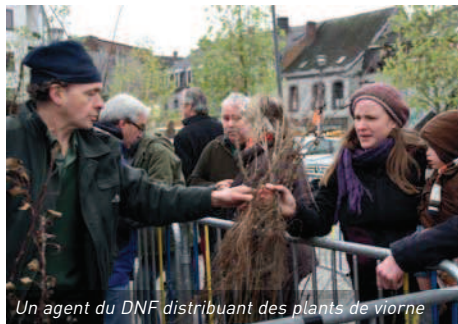
Un agent du DNF distribuant des plants de viorne