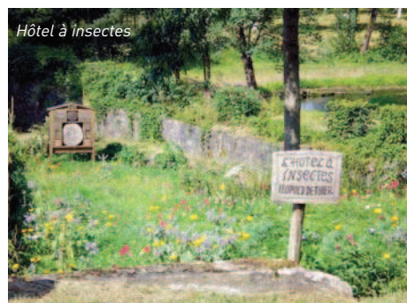
Hôtel à insectes