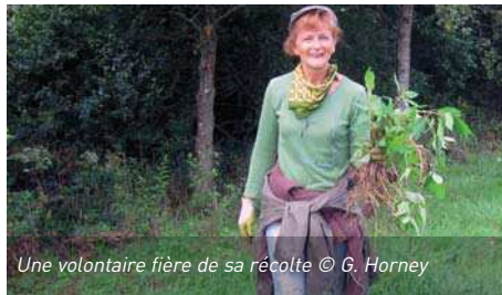
Une volontaire fière de sa récolte

Sous la conduite du DNF et dans le cadre du plan d'action "Balsamines" du PCDN de Couvin, quelques bénévoles de la régionale Natagora ESM ont consacré la journée du 12 août à l'arrachage de la Balsamine de l'Himalaya ( Impatiens glandulifera ) plante rivulaire invasive par excellence et qui, laissée libre de croître, peut envahir complètement les berges de nos rivières en ne laissant aucune chance aux autres plantes indigènes. Certaines zones de l'Eau Noire sont plus touchées que d'autres et les débarras de cette invasive nécessite plusieurs interventions par an. Aussi donc toute assistance apportée aux actions de destruction de la Balsamine de l'Himalaya est un geste productif pour la protection de la nature. N'hésitez pas donc à rejoindre l'équipe des bénévoles du PCDN qui organise ces opérations d'arrachage. Contact: Cindy Brosius c.brosius@publilink.be