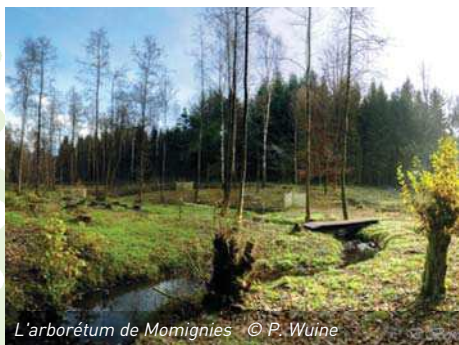
L'arboretum de Momignies

Photos et infos sur www.arboretummomignies.be (Patrice Wuine ; tel 0495 542001)