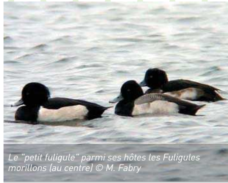
Le "petit fuligule" parmi ses hôtes les Fuligules morillons (au centre)