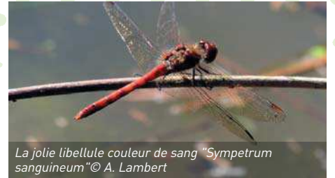
La jolie libellule couleur de sang " Sympetrum sanguineum "

bourdons, grenouilles... rien n'a manqué à cette belle journée de partage et de travail en faveur de la nature. Chaque année, cette gestion est au programme. Rejoignez-nous, vous ne le regretterez pas!