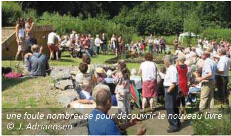
une foule nombreuse pour découvrir le nouveau livre

Contactez-nous pour en savoir plus: 060/ 21 49 28 ou centreethnobotanique@aquascope.be