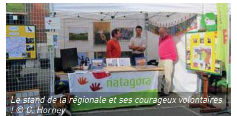
Le stand de la régionale et ses courageux volontaires !