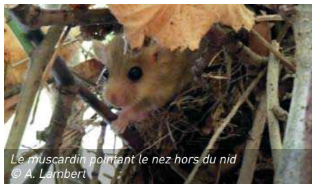
Le muscardin pointant le nez hors du nid