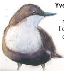
Cincle plongeur

Yves Fagniard (YF): Très jeune j'étais attiré et même passionné par l'observation des animaux en général. Il faut dire que j'habitais à quelques mètres du Bois de Ghlin Baudour. Ça aide...!