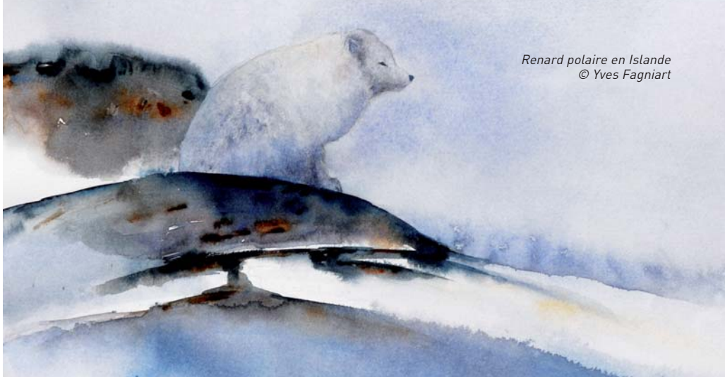
Renard polaire en Islande

L'Islande reste le dernier grand espace naturel et sauvage d'Europe, un pays magnifique