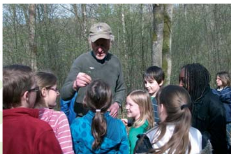
Notre président devant un public fort attentif.

ont adoré la visite du Moulin des Bois commentée avec sa truculence habituelle par Erik Damman !!!