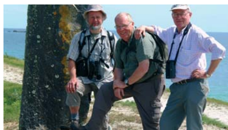
Le trio infernal !

Du 08 au 14 mai: Séjour sur la presqu'île de Quiberon. Natagora ESM a organisé avec l'aide de Nature et Terroir un séjour nature d'une semaine dans la jolie presqu'île de Quiberon! ( Voir article détaillé dans pages précédentes)