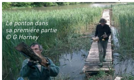
Le ponton dans sa première partie

Après plusieurs jours de "dur labeur" le ponton tout de chêne bâti atteint finalement le petit îlot dans l'étang sur lequel un poste d'observation ornithologique sera bientôt érigé.