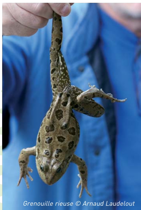
Grenouille rieuse

Arrivée en Wallonie suite à la vente de "grenouilles de jardin" par les marchands de plantes aquatiques il y a quelques décennies, l'espèce se répand à une vitesse impressionnante. En Brabant, en Hesbaye, dans la majeure partie de la vallée de la Meuse, dans la vallée de la Sambre et dans le Condroz au sud de Charleroi, la grenouille rieuse s'est tellement bien adaptée qu'elle est devenue la grenouille "verte" la plus abondante. En plus de son caractère invasif, elle entre en compétition avec les grenouilles vertes indigènes et tend à les faire disparaître. Une bien triste nouvelle pour notre région qui accueille encore de remarquables populations de grenouilles vertes.