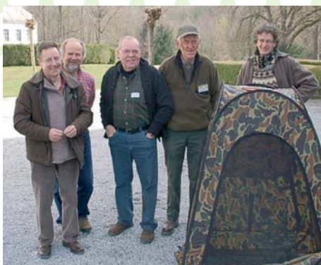
L'équipe cheville ouvrière de l'organisation

Domaine St Roch: Conférences pointues, matériel nouveau, bilans 2009 et 2010, diapos prises sur le terrain, échanges scientifique et le bonheur des bagueurs.