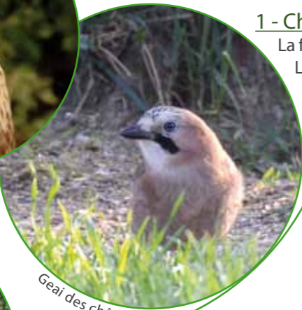
Geai des chênes