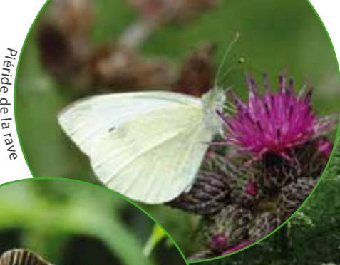
Piéride de la rave