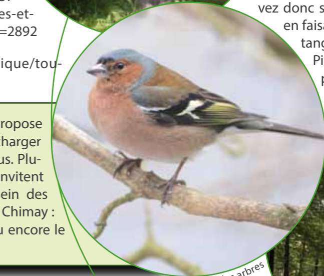
Pinson des arbres