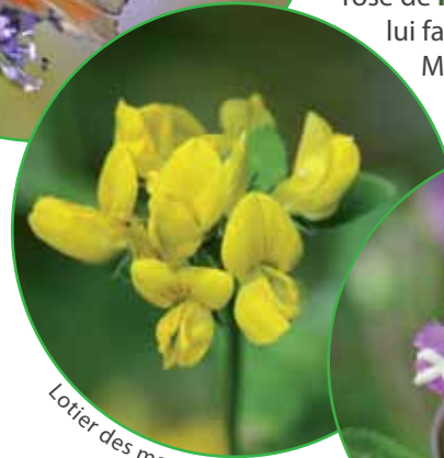
Lotier des marais