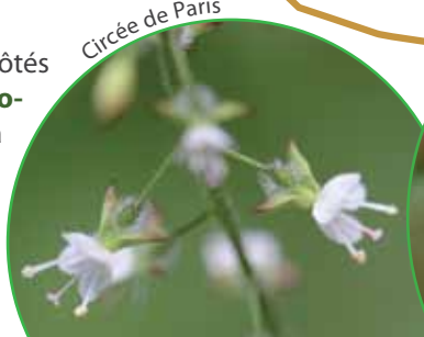
Circée de Paris

Au bord du chemin l'épipactis à larges feuilles s'épanouit aux côtés de la minuscule circée de Paris et du géranium herbe-à-Robert . Ce dernier, aussi nommé bec-de-grue en raison de la forme de son fruit, est une plante médicinale aux multiples vertus : elle est réputée soigner les angines, les hémorragies ou la dysenterie et l'huile essentielle qu'elle contient est anti-septique.