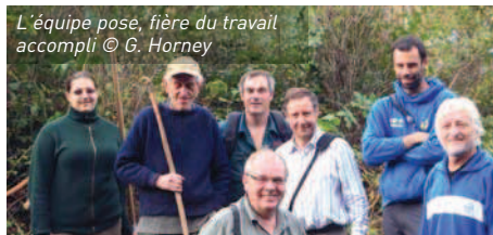
L'équipe pose, fière du travail accompli