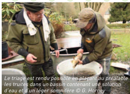
Le triage est rendu possible en plaçant au préalable les truites dans un bassin contenant une solution d'eau et d'un léger somnifère

du Moulin des Bois de notre président, en vue de préparer la campagne 2012 de fécondation et d'incubation des œufs. Le travail consiste à trier et compter les mâles et femelles géniteurs, en écartant les individus immatures qui seront remis dans les bassins d'élevage. Quelques belles pièces seront, entre autres, capturées comme on peut en juger sur la photo ci-jointe.