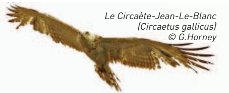
Le Circaète-Jean-Le-Blanc ( Circaetus gallicus )

Depuis quelques mois la présence de l'aigle mangeur de serpents agitait le monde des ornithologues. Mais c'est en août qu'il fut observé et photographié sous toutes ses coutures avant de nous quitter définitivement fin du mois. Adieu bel oiseau et à te revoir bientôt...!