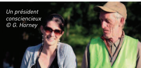
Un président consciencieux