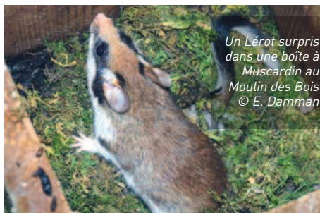
Un Lérot surpris dans une boîte à Muscardin au Moulin des Bois

Un petit mammifère bien sympathique quoique quelquefois dérangent lorsqu'il s'installe chez vous, le lérot semble assez présent cette année. En témoignent les nombreuses observations collectées ce mois-ci à son sujet.