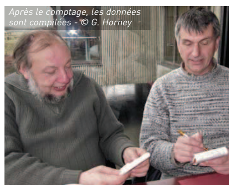
Après le comptage, les données sont compilées