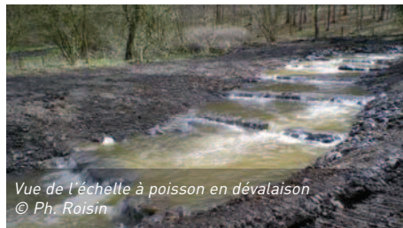
Vue de l'échelle à poisson en dévalaison

cours de la rivière sur près de 300 mètres, à l'inverse de Nismes où une toute nouvelle passe à poissons a été réalisée. Les nombreuses aires de repos et les jolis méandres réalisés après 12 semaines de travaux seront superbement intégrés dans le paysage du domaine. Une très bonne nouvelle pour la faune piscicole, depuis les sources du Ry de Rome jusqu'à la Meuse.