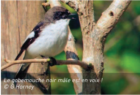
Le gobemouche noir mâle est en voix !

Depuis quelques années déjà, le Gobemouche noir faisait l'objet d'un suivi plus particulier par quelques bénévoles de la cellule ornithologique ESM. Cette année encore son retour au même endroit confirme sa nidification. Le même individu que les années précédentes ? Difficile d'imaginer un si petit oiseau traversant mers et continents pour revenir nicher au même endroit. Mais pourquoi pas ? La Nature a des raisons que la raison ignore !! (Voir article détaillé dans le présent n°)