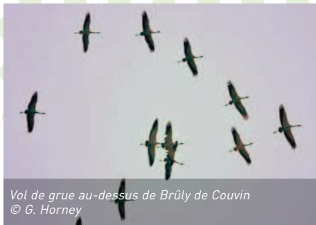
Vol de grue au-dessus de Brûly de Couvin