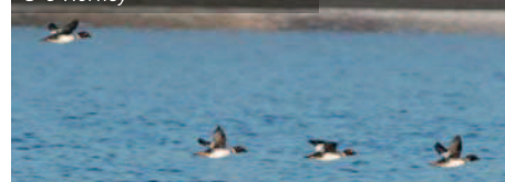
Envol de Macreuses brunes

Souignons également la brève apparition d'un pygargue à queue blanche juvénile au-dessus du lac de la Plate Taille et le retour d'une petite dizaine de jaseurs boréaux. En bref, un hiver riche en observations passionnantes.