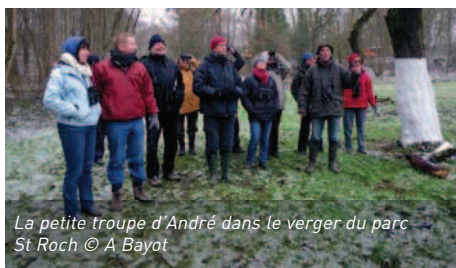
La petite troupe d'André dans le verger du parc St Roch

Après une balade le long de l'Eau Noire qui nous permettra d'observer chardonnerets et verdiers, Philippe nous accueille dans son superbe domaine de Saint Roch, pour terminer en toute beauté cette matinée, glaciale mais riche en observations.