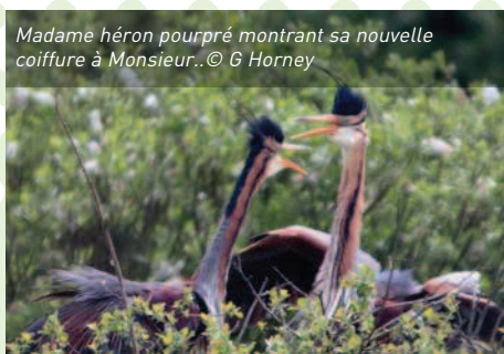
Madame héron pourpré montrant sa nouvelle coiffure à Monsieur...

La Brenne, le pays «des mille étangs», protégée au titre de la convention Ramsar de 1991, en plein centre de la France, fait rêver plus d'un ornitho...! Là, s'interpénètrent l'eau, les bois, les landes et les prairies. Imaginez un pays vert, vallonné ou non, parsemé de bocages et de cultures où les mares et les étangs règnent en maîtres... Le paradis pour les oiseaux d'eau et d'autres espèces plus ou moins rares. Pensez-donc, pas moins de 150 des 300 espèces qui visitent les 3000 étangs exploités pour la pisciculture sont nicheuses ici ! Blongios nains, bihoreau, hérons pourprés, guifettes moustacs, hérons garde-boeufs, pluviers dorés, râles d'eau, nettes rousses, etc... Avec plus de 1000 espèces de plantes, autant dire que les botanistes ne sont pas en reste ! Et à tout seigneur tout honneur, n'oublions pas la cistude, cette tortue emblématique qui partage la vedette avec la tortue d'Hermann et l'émyde lépreuse. Tout ce beau monde est visible au départ de différents postes d'observation, judicieusement installés dans les nombreux sites lacustres, aux noms souvent évocateurs comme l'étang de la Chérine, de la Sous, des Essarts et autre Picadon. Malgré le soleil qui nous a un peu (beaucoup) boudés, «The» ambiance était au rendez-vous. Grâce en