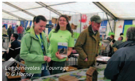
Les bénévoles à l'ouvrage ...

ESM participe pour la seconde fois au carrefour des générations organisé à Philippeville.