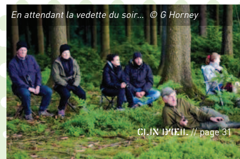
En attendant la vedette du soir...