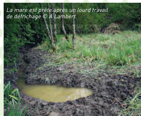
La mare est prête après un lourd travail de défrichage

Même si ce n'est pas véritablement une réserve Natagora, on fait comme si... ! Puissent les panneaux installés faire reculer les perturbateurs du site ! En tous cas, avec la densification naturelle des aubépines et prunelliers, les quads ne passent apparemment plus. Reste à continuer les fermetures des accès latéraux pour que notre petit coin de paradis herpétologique et ornithologique ne se transforme pas en décharge publique... on a déjà fait un fameux boulot en ce sens ! Et... on est maintenant sûr qu'il ne faudrait pas grand-chose pour que la mare destinée au Triton crêté redevienne son habitat : quelques coups de pelle mécaniques seraient suffisants. La mégaphorbiaie a été rouverte. Le castor manifestement bien présent sur la Brouffe à hauteur de la réserve et aussi sur l'Eau Blanche, va peut-être nous faire profiter aussi de ses dons d'ingénieur de l'environnement.