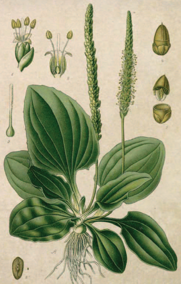
Pl. 271. Plantain majeur. Plantago major L.

«On mettait les feuilles telles quelles entre nos cuisses quand on faisait les foin pour diminuer les démangeaisons»