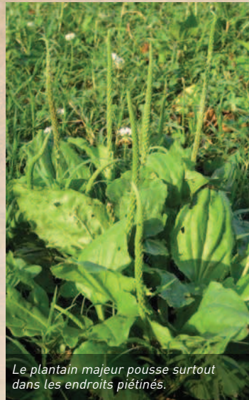
Le plantain majeur pousse surtout dans les endroits piétinés.

Mais le Plantain a plus d'un tour dans sa rosette! En plus d'être médicinal, il est aussi comestible: les jeunes feuilles du Plantain (surtout le majeur) aromatisent agréablement les salades. Ses feuilles plus âgées peuvent être cuites comme légumes et ses grappes de fruits grillées à la poêle. Testez-le! Il a un surprenant goût de... champignon!