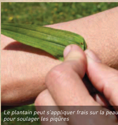
Le plantain peut s'appliquer frais sur la peau pour soulager les piqûres