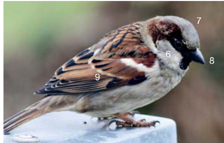
Moineau domestique mâle

Ces schémas montrent bien les différences entre ces trois espèces: la calotte grise aux côtés marrons du Moineau domestique; le collier blanc, la calotte brune et la tache noire sur les joues du friquet et enfin la tête gris ardoise et le bec plus fin de l'Accenteur mouchet, qui ne fait pas partie de la famille des moineaux, mais de celle des accentueurs. Notez aussi la barre alaire blanche chez les moineaux.