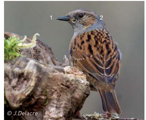
Accenteur mouchet mâle et femelle

Les Comités de rédaction de La Grièche et du Clin d'œil Nature.