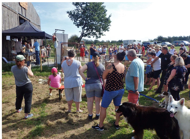
Une fête familiale sous une météo estivale