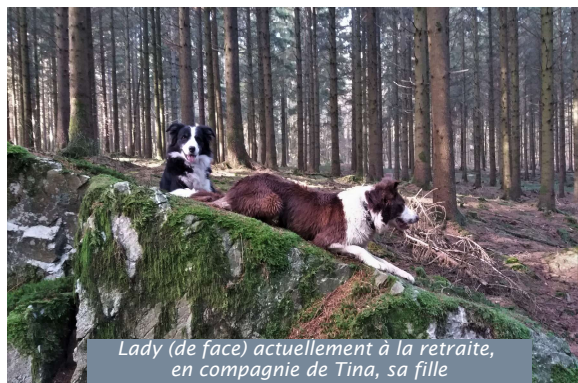
Lady (de face) actuellement à la retraite, en compagnie de Tina, sa fille

Mais qui dit chien de troupeau, dit brebis ! Et ils en acquièrent trois ou quatre.