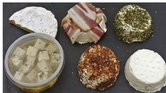
Les fromages frais de Caro ...

Et qui dit plus grand cheptel, dit plus de lait ! Caro suit alors une formation et se spécialise dans sa transformation.