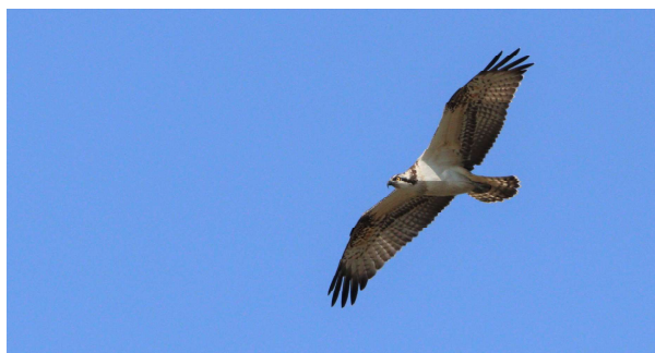
L'un des deux balbuzards en survol de l'étang.

Visiteur habituel de l'étang à la fin de l'été, l'aigle pêcheur ne pouvait manquer l'aubaine de la vidange précoce du plan d'eau pour travaux d'aménagement ! L'occasion pour de nombreux observateurs et photographes de profiter à leur tour du passage de ce migrateur. Le 3 septembre, ce sont deux balbuzards qui tournoient dans les airs avant de plonger, serres en avant, pour capturer l'un ou l'autre poisson. Un vol magnifique, capté par l'objectif du photographe !