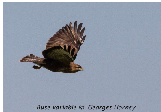
Buse variable

Une trentaine de personnes pour cette balade organisée par Carmeuse, dans le cadre du festival Nature de Namur. Tycho et André ont emmené les participants sur l'ancienne carrière d'Aisemont, à la découverte de la végétation du moment et à l'affût de la présence des oiseaux du bocage. Dès le début de la promenade, trois buses ont survolé le groupe en lançant leurs miaulements reconnaissables et profitant des courants ascendants pour planer sans efforts. Sur la pelouse calcaire et près de l'ancienne carrière, Tycho a retenu l'attention du public en détaillant la faune et la flore typiques de ces milieux. Le tout sous un soleil radieux !