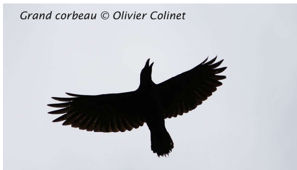
Grand corbeau © Olivier Colinet

Une bonne dizaine de personnes étaient présentes pour ce premier jeudi d'automne. À cette occasion, nous tentions notre chance sur un nouveau parcours. Bien nous en a pris puisque dès le début de la promenade, les premiers groupes de Pigeons ramiers nous survolent. Bergeronnettes grises, Tariers pâtres, Pinsons des arbres et Chardonnerets élégants nous accompagnent sur la suite du parcours. Presqu'au terme de notre boucle, un Bruant jaune se laisse brièvement observer. Mais nous sommes distraits par le passage incessant de Grives musiciennes et mauvis et surtout, peu après, par les cris typiques de trois Grands corbeaux en vol migratoire que nous pourrions admirer juste au-dessus de nos têtes !