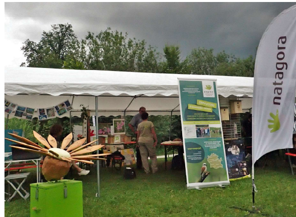
Le stand de la régionale, avec en avant-plan, la splendide marguerite de notre ami Rémy.

À cette occasion, notre régionale était bien présente, à la fois pour contribuer au recensement qui a atteint et même dépassé l'objectif, mais également pour accueillir le public, invité le samedi et le dimanche à participer à l'événement au travers de balades, d'animations et de stands didactiques.