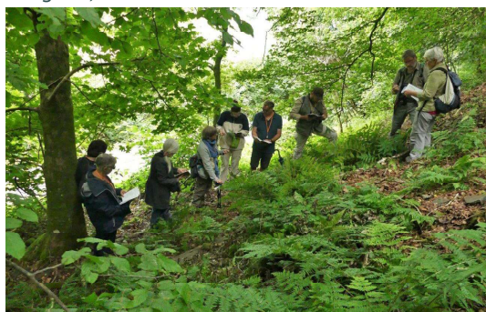
Une partie de l'équipe en pleine détermination !

Les inondations sont encore bien présentes dans les conversations et les orages nous ont gratifiés d'averses violentes ces derniers jours... Dix participants se retrouvent malgré tout au rendez-vous et ils ont eu raison ! Une journée sèche et parfois bien ensoleillée nous attend, favorable à la découverte du monde des fougères. Trop peu connu, il ne manque pourtant pas d'intérêt, notamment celui de rompre un peu l'ennui naturaliste de fin d'été : les oiseaux muent et sont silencieux, les fleurs fanent et les insectes se font plus rares... tandis que les fougères profitent de cette période pour se reproduire ! Elles sont généralement hébergées sur des rochers, des bords de cours d'eau, d'anciennes carrières et ardoisières, des forêts de versants ombragés et des endroits marécageux, voire tourbeux.