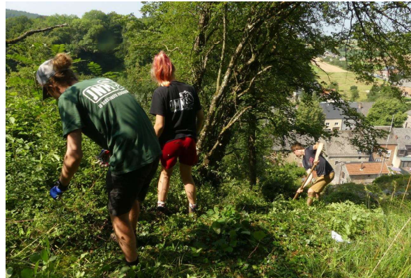
Une partie de l'équipe en pleine action !

vers le village, juste en-dessous de la Croix des Roches. Le 21 juillet, une vingtaine de garçons et filles originaires de la région de Zottegem arrivent de Nismes à vélo, armés de sécateurs. Thierry leur remet les coupe-branches glanés auprès de quelques membres de la régionale et, renforcée par Nadine, cette belle équipe se met au travail ! Une gestion efficace qui permettra de dégager considérablement cette zone inaccessible avec des moyens mécanisés.