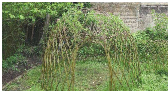
Infos : https://www.ecomusee-du-viroin.be/villages-des-debranchés

D'où l'idée de susciter des rencontres dehors, de créer un espace avec les participants, naturel et en lien direct avec ce qui nous entoure, d'initier une connaissance plus vive de son environnement et surtout, de travailler ensemble, de mutualiser les forces vives. D'autres dates sont prévues afin de poursuivre cette œuvre végétale.