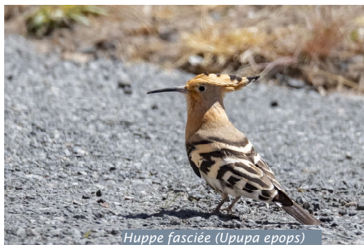
Huppe fasciée ( Upupa epops )

« Ma communion avec la nature m'offre l'occasion de mieux gérer mes tensions intérieures »