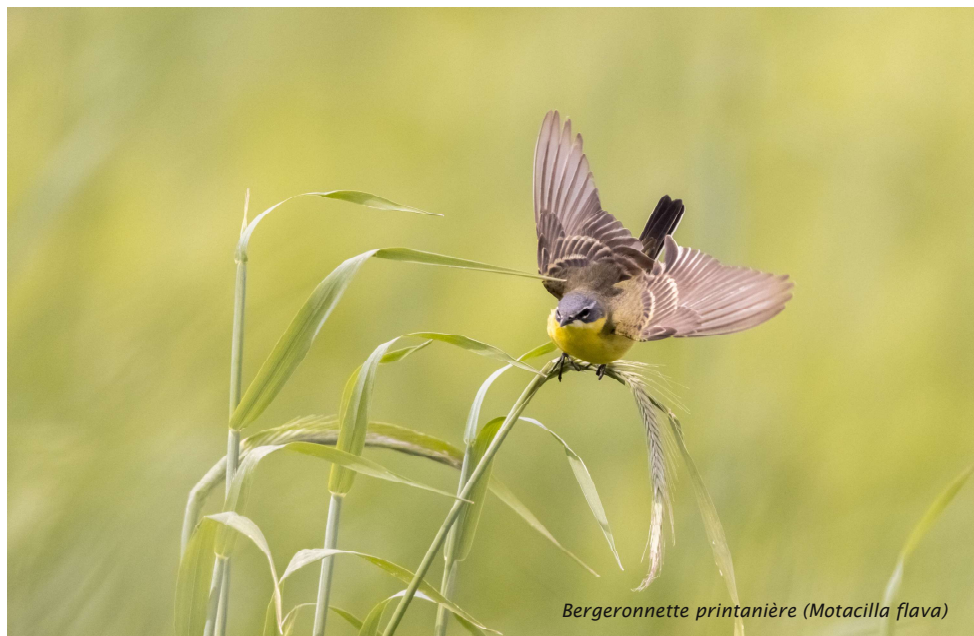
Bergeronnette printanière ( Motacilla flava )

« Je collabore régulièrement avec l'équipe de gestion de l'Aquascope de Virelles. Je leur fournis des images pour la promotion de leurs activités »