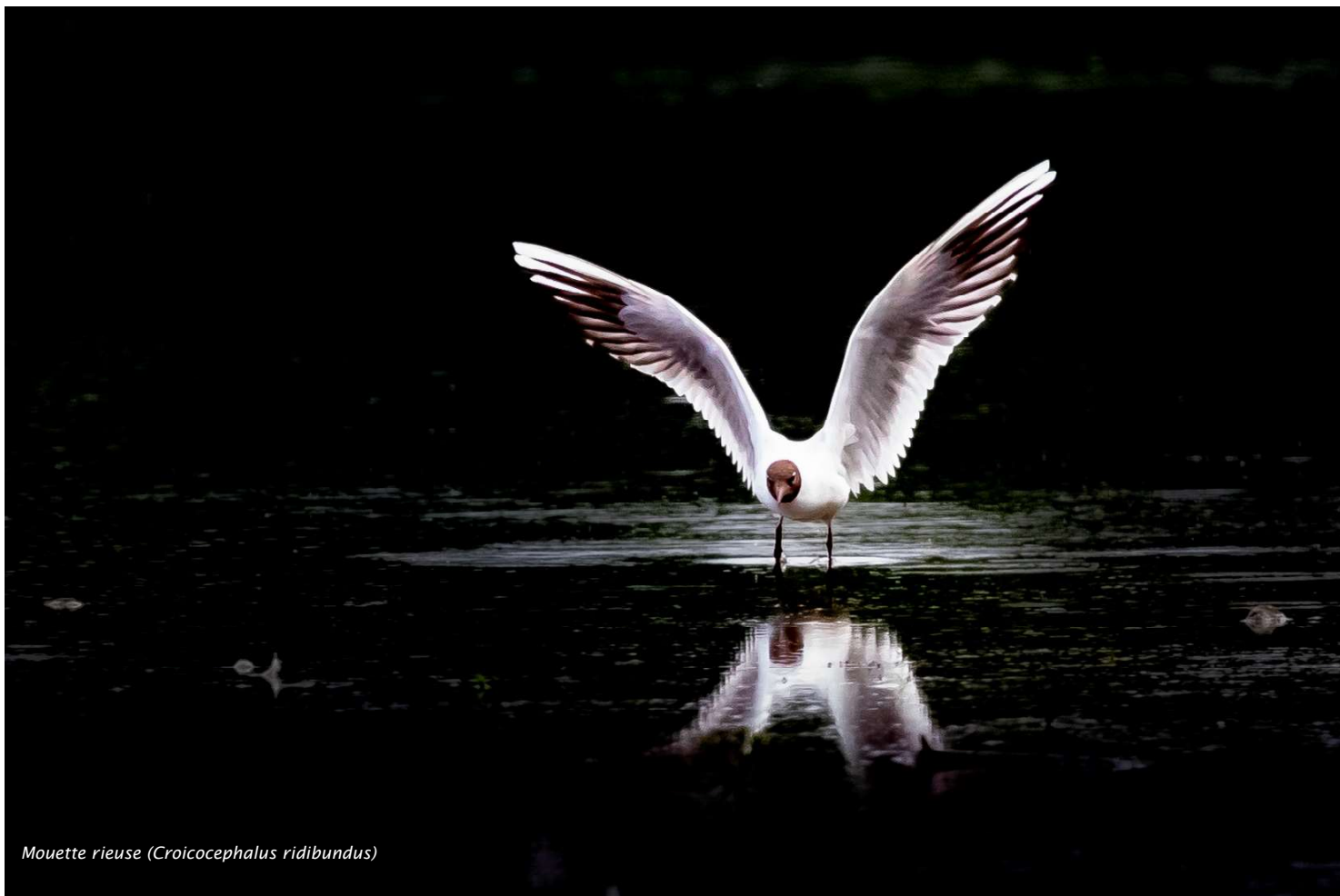
Mouette rieuse (Croicocephalus ridibundus)

« Ma relation intime avec la nature ne remonte qu'à une petite quinzaine d'années »