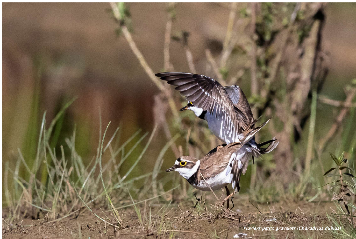
Pluviers petits gravelots (Charadrius dubius)

« Ma relation intime avec la nature ne remonte qu'à une petite quinzaine d'années »