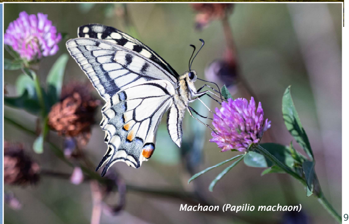
Machaon ( Papilio machaon )