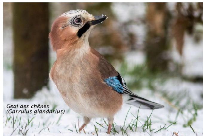
Geai des chênes ( Garrulus glandarius )

C'est donc tout naturellement qu'il suit les 3 années de la formation ornitho de Natagora, qui se donne à Philippeville ... et qu'il se perfectionne depuis 2018 grâce à des cours du soir de photographie à l'IEPS dans la même ville.