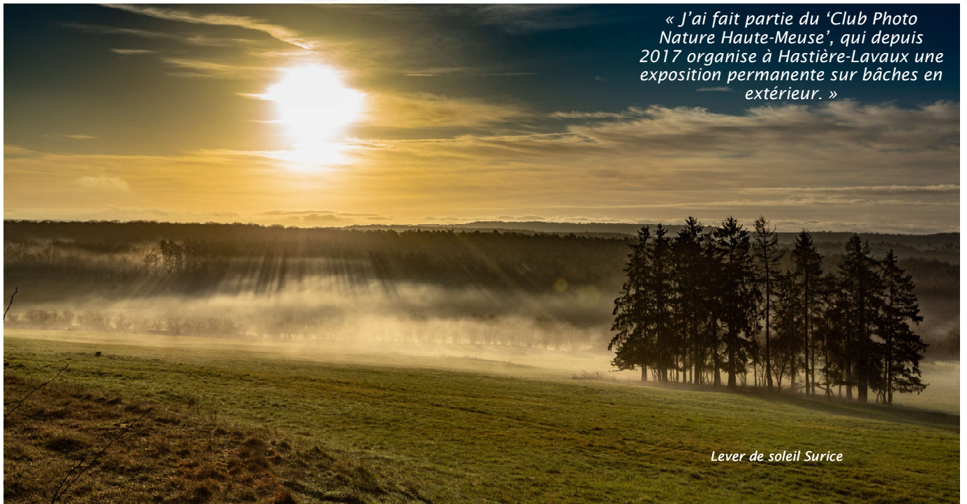
Lever de soleil Surice

« J'ai fait partie du 'Club Photo Nature Haute-Meuse', qui depuis 2017 organise à Hastière-Lavaux une exposition permanente sur bâches en extérieur. »