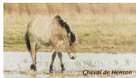
Cheval de Henson

« Je collabore régulièrement avec l'équipe de gestion de l'Aquascope de Virelles. Je leur fournis des images pour la promotion de leurs activités »