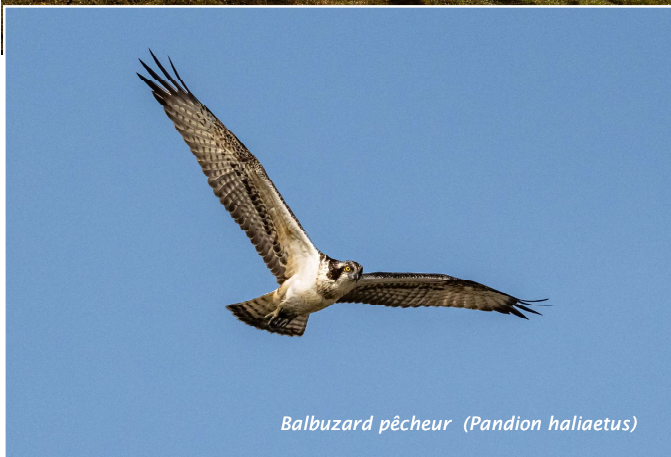
Balbuzard pêcheur ( Pandion haliaetus )