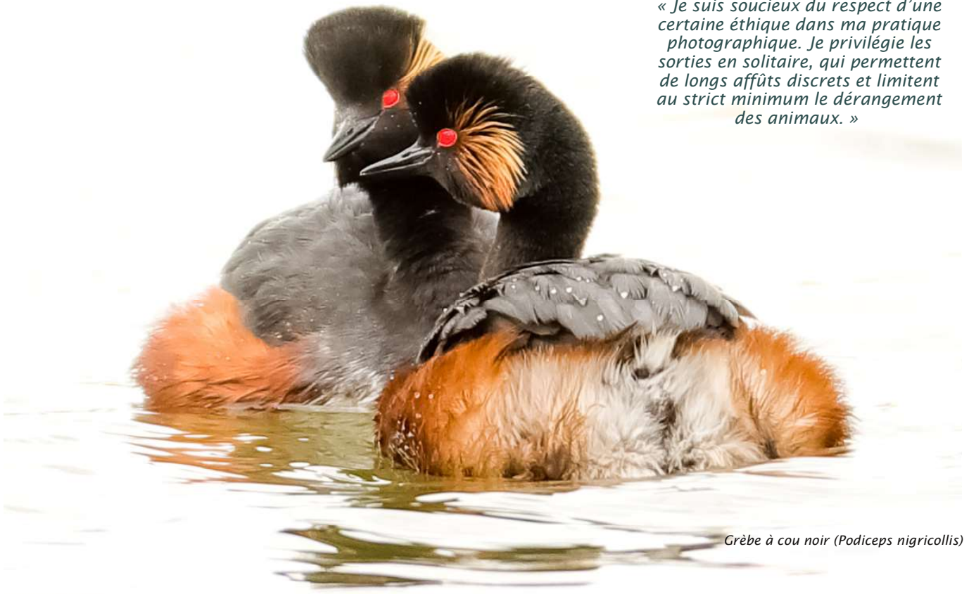
Grèbe à cou noir ( Podiceps nigricollis )

« Je suis soucieux du respect d'une certaine éthique dans ma pratique photographique. Je privilégie les sorties en solitaire, qui permettent de longs affûts discrets et limitent au strict minimum le dérangement des animaux. »