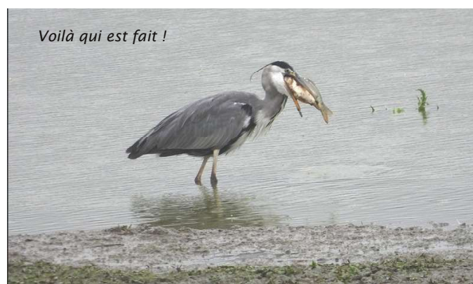
Voilà qui est fait !