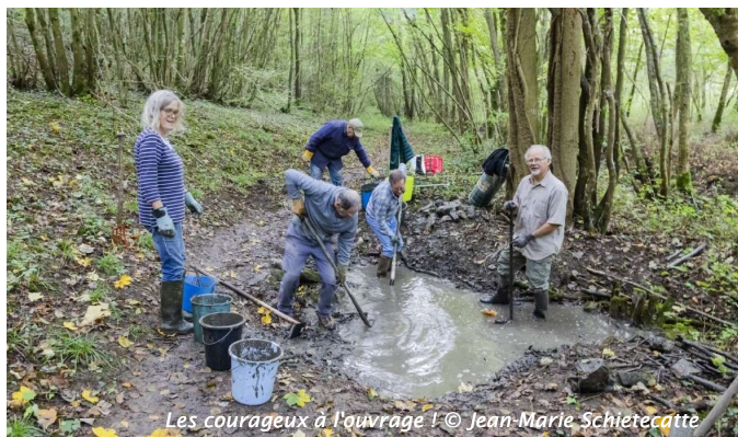
Les courageux à l'ouvrage !