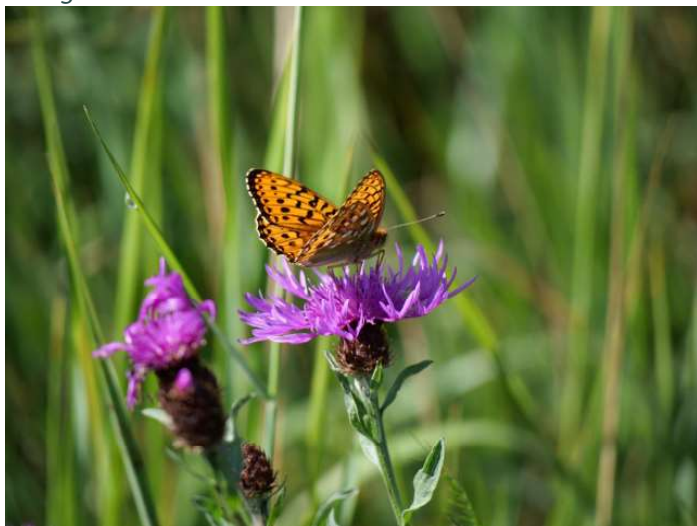
Grand nacré