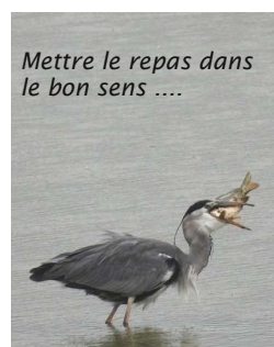
Mettre le repas dans le bon sens ....