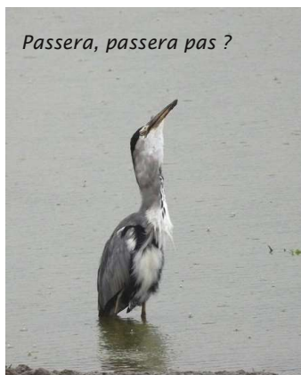
Passera, passera pas ?