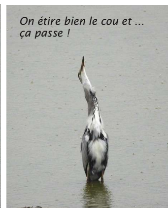
On étire bien le cou et ... ça passe !