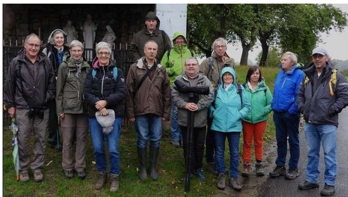
Le groupe au départ sous une pluie battante !