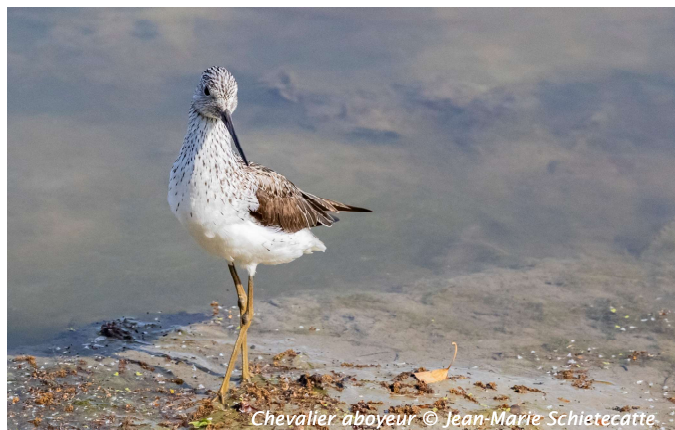
Chevalier aboyeur © Jean-Marie Schietecatte