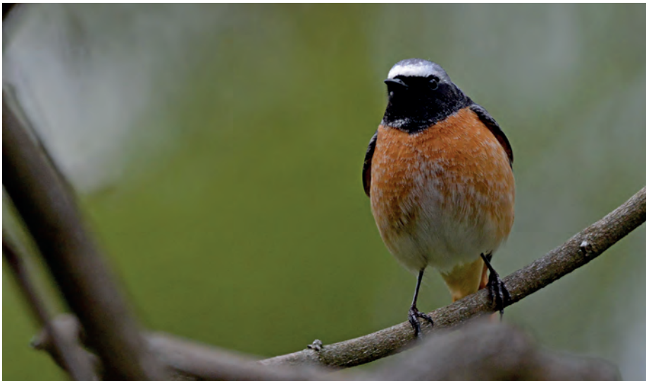
Rougequeue à front blanc, bruly de Pesche

« En avril, ne te découvre pas d'un fil », dit le dicton ! Il était approprié à la météo très fraîche de cette matinée qui a, malgré tout, convaincu une dizaine d'habitues de se retrouver au cœur de ce village, juché comme c'est souvent le cas au sommet d'une butte calcaire. Depuis la petite place de l'église, le groupe découvre le joli paysage formé par le bocage en contrebas et le village de Romedne tout proche.