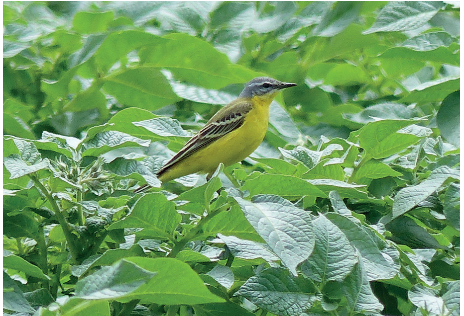
Bergeronnette printanière - Florennes (Chaumont)

Au total, pas moins de 34 espèces auront été recensées lors de cette fraîche matinée.