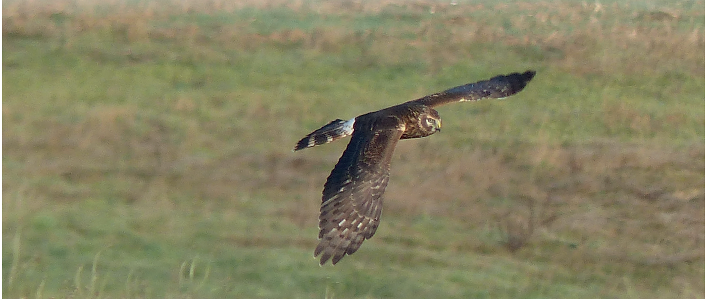
Busard Saint-Martin - Hemptinne