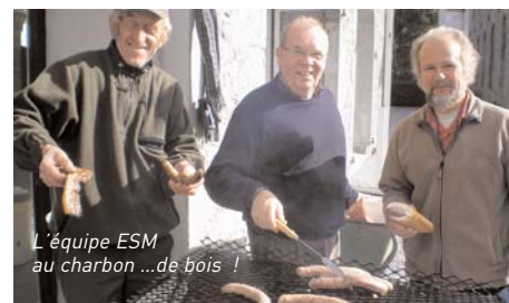
L'équipe ESM au barbecue...de bois!