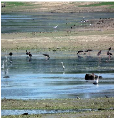
Cigognes noires, hérons et...ragondins sur un site des lacs d'Orient

Plus de 60 espèces d'oiseaux observées et des milliers de souvenirs plein la tête. Une superbe expérience.