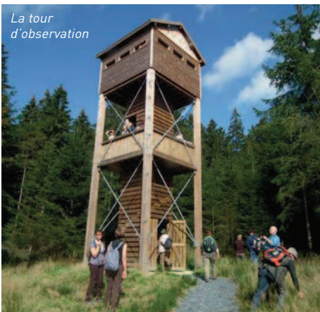
La tour d'observation

teurs...!), on avait une très belle vue. Nous avons été faire la balade et nous avons vu beaucoup de champignons (ils étaient tellement beaux que j'ai fait plein de photos), des traces de sangliers et d'écureuils... Avant la deuxième promenade, nous sommes revenus au point de départ pour manger. Ensuite nous sommes repartis dans les Fagnes et on a marché sur des caillebotis, on a vu plein de plantes, entendu des oiseaux chanter, observé la plante "groseille du loup"*, ou