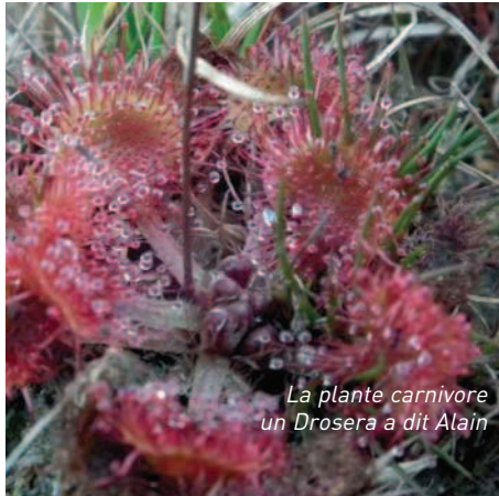
La plante carnivore un Drosera a dit Alain

quelque chose comme cela, celle qui ne se mange pas et puis encore d'autres traces... J'ai pu aussi observer une plante carnivore (depuis j'en ai une chez moi) ensuite nous avons vu un rapace** et une cigogne se battre*** (cela ne se voit pas tous les jours).