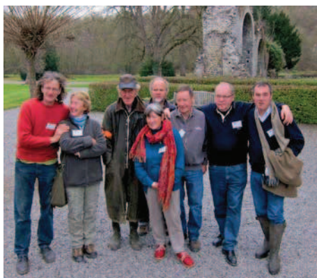
L'équipe ESM devant un vestige de l'activité sidérurgique du 18 e siècle.

C'est le domaine de St Roch à Couvin qui fut choisi et c'est à la régionale Natagora ESM que fut confiée l'organisation de la logistique.