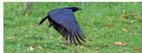
A tire d'ailes, l'oiseau noir...