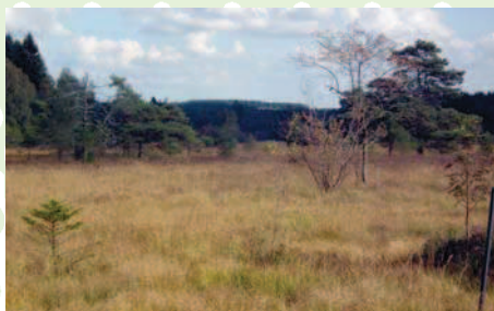
La Fange du Bihain

14h00: Revenus à notre point de départ pour une courte pause sandwiches nous repartons pour la longue marche proprement dite sur la Fange de Bihain: une énorme tourbière qui s'étend à perte de vue.