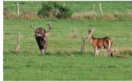
Sans hésiter le maître des lieux franchit d'un bond les barbelés au secours de sa belle..