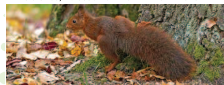
Poil- de carottes sur le qui-vive