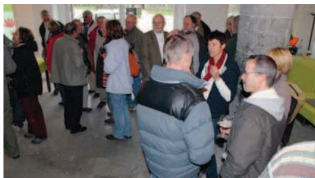
De nombreux contacts se seront créés.

Juste après la dégustation de la tarte artisanale locale tout le monde s'est regroupé pour la photo de famille.