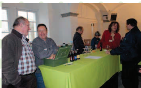
Une caisse bien gardée et un bar bien garni...!

L'apéro et le lunch offerts par Natagora furent l'occasion de faire plus amples connaissances autour du bar bien garni par l'équipe ESM.