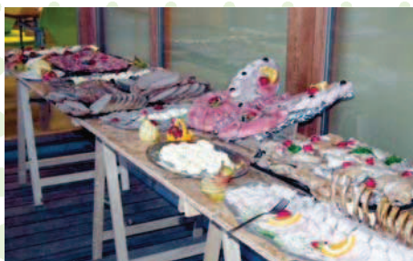
Un buffet bien appétissant qui semble attirer beaucoup de gourmands.