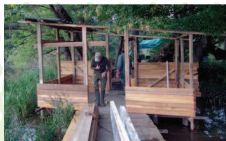
On commence à voir où on va !!!