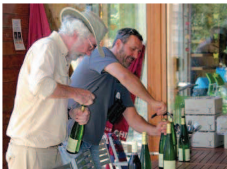
Le soleil est au rendez-vous

Même si la participation est plus timide que prévu (de nombreuses réservations n'ont pas été honorées...), sans doute à cause de la rentrée scolaire toute fraîche, tous les éléments sont réunis pour faire de cette journée une belle réussite. Soleil ardent, accueil chaleureux du personnel de l'Aquascope, environnement superbe, buffet généreux offert par ESM, ambiance plus que conviviale.