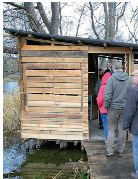
Le tout nouvel observatoire au bout du ponton

En mai 2012, les excursions NATAGORA ESM se coupent en 4 !!! 4 jours et 3 nuits à TEXEL SUR L'ÎLE AUX OISEAUX.