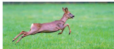
Il fait des bonds, des bonds!

Au cours d'une sortie dans le domaine de St Roch, notre photographe a pris sur le vif quelques instantanés spectaculaires. Bravo à Bert!