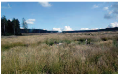
Le grand plateau qui jouxte la tour d'observation

11h45: tout le monde descend! Nous sommes sur le plateau de la Baraque de Fraiture au pied d'une grande tour d'observation qui ressemble aux anciennes tours de guet romaines... Devant nous s'étend l'énorme plateau bordé de forêts de sapins à l'est et au sud, où on peut se rendre compte du succès du Projet LIFE.