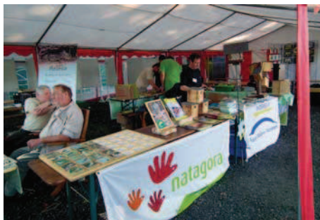
Le stand Natagora ESM à côté de celui de nos amis de Liège

Ce jour-là, l'Asquascope et le soleil se sont mis sur leur 31 pour recevoir les nombreux visiteurs de la 3 ème édition du Festival. Cette fois le castor et le balbuzard étaient à l'honneur. Comme toujours l'équipe de ESM était à son poste derrière le stand de Natagora.