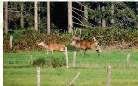
Un rival tente de s'approcher d'une biche

prenant semble vouloir s'approcher un peu trop d'une femelle. Spectacle assuré, devant un renard qui passe devant nous indifférent!!